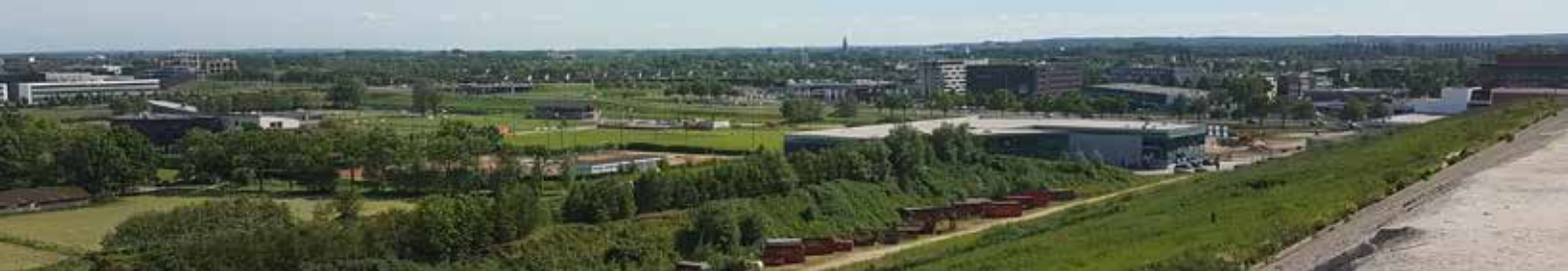
Uitzicht vanaf de stortlocatie richting Kattenbroek