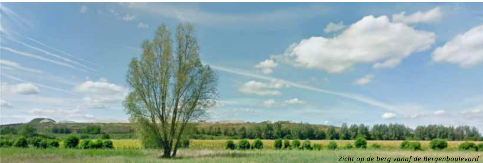
Zicht op de berg vanaf de Bergenboulevard