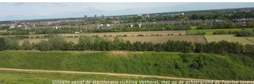
Uitzicht vanaf de stortlocatie richting Vathorst, met op de achtergrond de Foortse torens

Deze uitgave is met zorg samengesteld, maar u kunt geen rechten ontlenen aan de inhoud ervan.