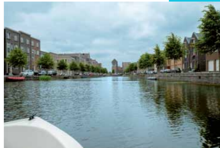
Markenhaven De laak

Vlak buiten Amersfoort ligt één de oudste polders van Nederland, de polder Arkemheen. Het is een groene oase tussen de stedelijke bebouwing van Amersfoort, het Gooi en de rest van de Randstad. Veel water- en weidevogels broeden en/of overwinteren er, of trekken door het gebied. U kunt er ontspannen doorheen fietsen, maar er mag ook (elektrisch) gevaren worden. Meer info: www.arkemheen-eemland.nl .