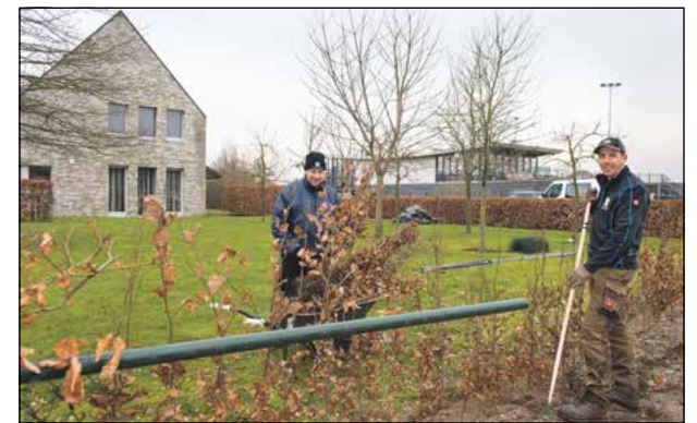
Hoveniers aan het werk aan de heg

Aan het kruispunt Caraïben-Heideweg worden nog wat andere aanpassingen gedaan om het punt overzichtelijker te maken. Zo komt er een uitritconstructie waar de Caraïben op de Heideweg uitkomt. De werkzaamheden zijn op maandag 9 april gestart. Het kruispunt is twee weken afgesloten. Verkeer wordt omgeleid.