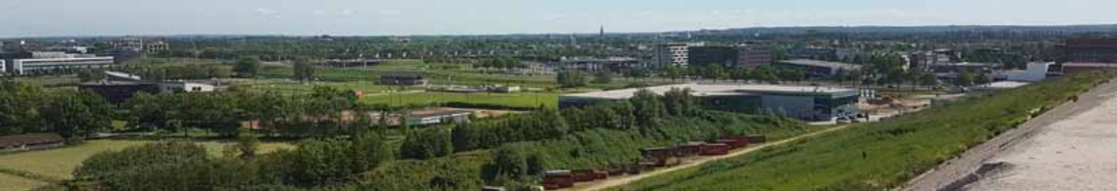
Uitzicht vanaf de stortlocatie richting Kattenbroek