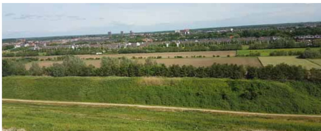
Uitzicht vanaf de stortlocatie richting Vathorst, met op de achtergrond de Foortse torens

Vrachtwagens van Renewi voeren afvalstoffen en secundaire bouwstoffen af- en aan. Dat kan stof veroorzaken. Het terrein wordt echter regelmatig besproeid, waardoor de ondergrond nat wordt. Dit vermindert het ontstaan van stof.